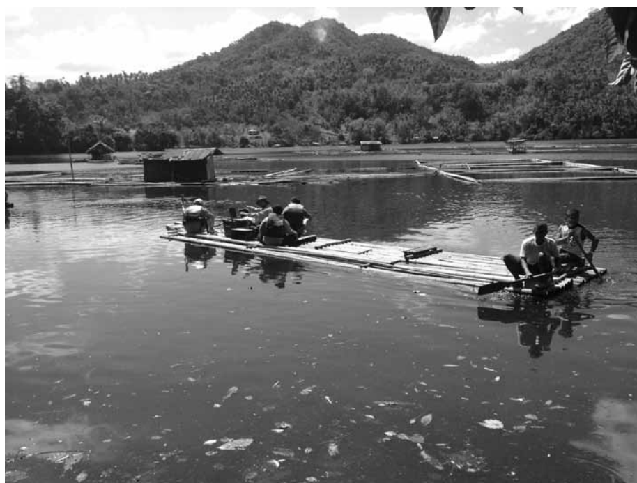
フィリピン、サン・パブロ市付近のマール（爆裂火口湖）での音波探査の調査風景。ティラピア養殖のために現地人が使っているバンブーボート（竹で作られた簡易筏）に各種装置を艀装しての探査。（2014年2月）