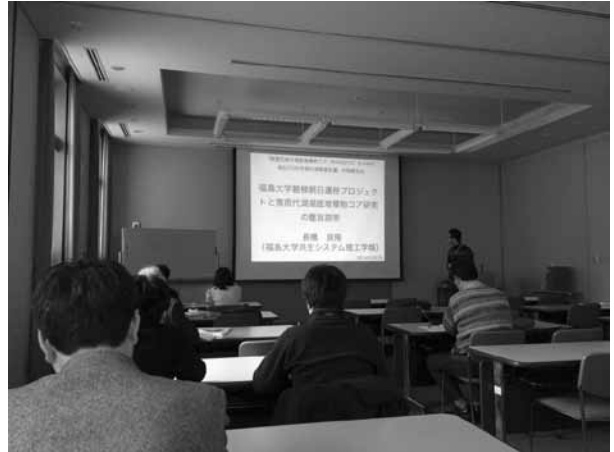
猪苗代湖研究集会の様子

私の研究ではこのコアを対象として、4.8 万年間の有機炭素量の変動を明らかにした。猪苗代湖