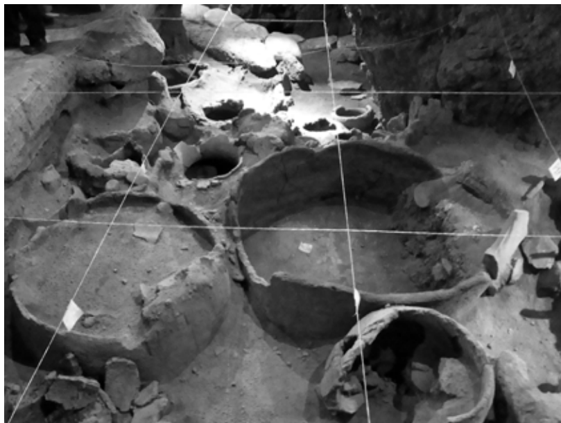
Areni-1 洞窟（アルメニア東南部）の世界最古（約 4,000 B.C.）のワイン醸造施設とされる遺構