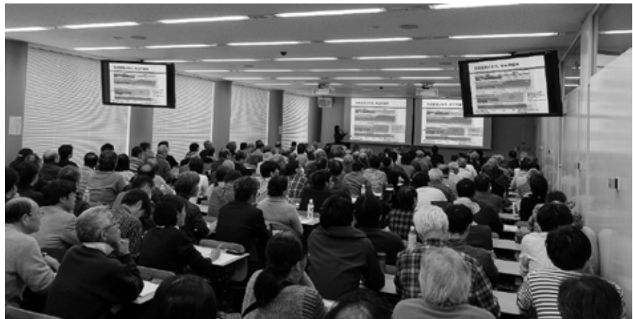
シンポジウムでの講演の様子

共催：産業技術総合研究所 地質調査総合センター、国立極地研究所 後援：文部科学省 科学研究費助成事業 新学術領域研究「熱-水-物質の巨大リザーバ：全球環境変動を駆動する南大洋・南極氷床」