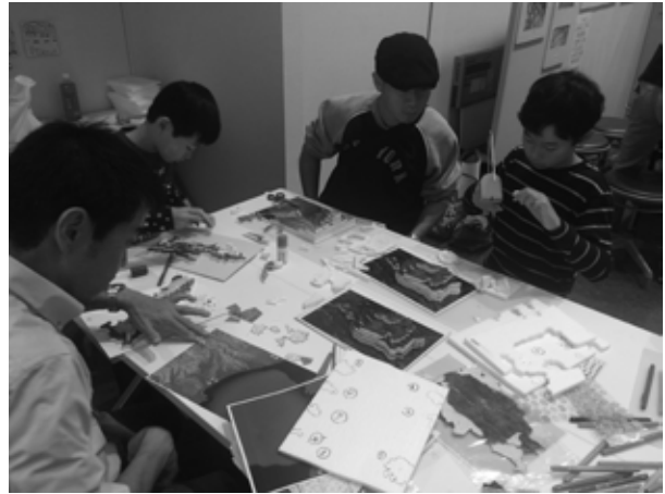
立体地形の模型をつくる参加者

その中でわが第四紀学会のブースは「見え見え～三重の地形と地質」と題して、御在所岳、答志島、伊勢平野といった三重県内の代表的な地形の立体模型の作成を企画しました（写真）。当初の計画では立体模型を作りながらそれぞれの地形・地質の成り立ちや第四紀という時代の紹介を行う予定でしたが、立体模型の作成の部分で十分に盛り上がってしまい、第四紀学や学会について一般への理解がどの程度深まったのか、担当の二人には若干の不安が残りました。今後同様の企画がある場合は来客者からアンケートをとり、内容の理解度や満足度を確認する必要もありそうです。なお、本学