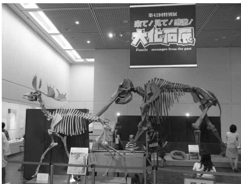
「来て！見て！感激！大化石展」の展示会場。 正面はコウガゾウ（黄河象）、左はヤベオオツノジカ。