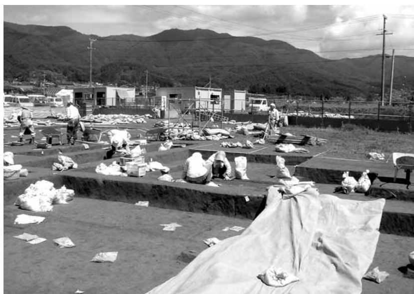
長野県飯田市竹佐中原遺跡の調査風景。ここは捏造事件後最初に調査された後期旧石器時代を遡る可能性のある遺跡で、その重要性から地形、火山灰、土壌、年代測定および植物珪酸体などを駆使した総合的な自然科学分析がなされている。(2005年7月12日 佐藤宏之撮影)