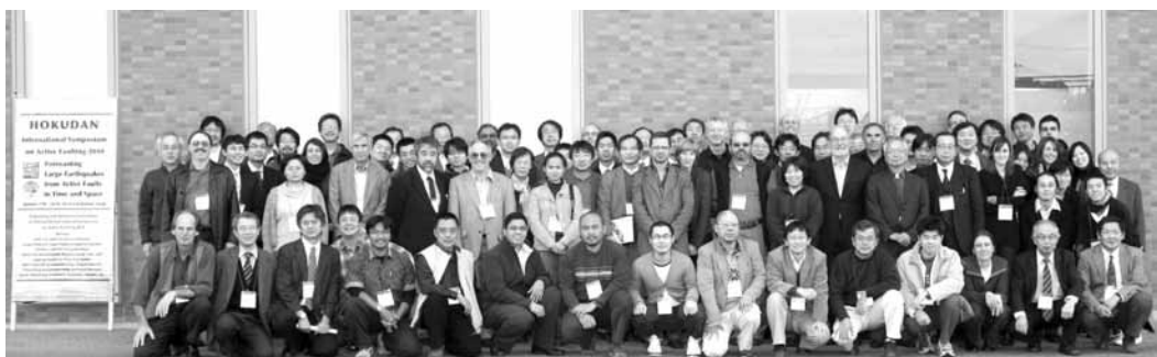
シンポジウム参加者の集合写真

20日は“Earthquakes and their forecasts, strong motion”セッションが開かれた。この