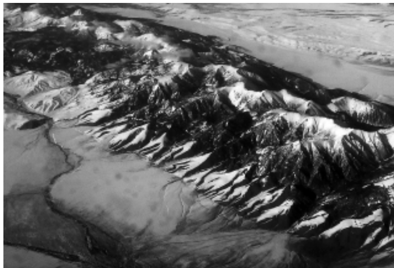
Basin and Range 北部 Lemhi 断層 Warm Creek セクションの三角 末端面と最終氷期の扇状地を切る低断層崖．アイダホ州中東部 Borah Peak 上空より．