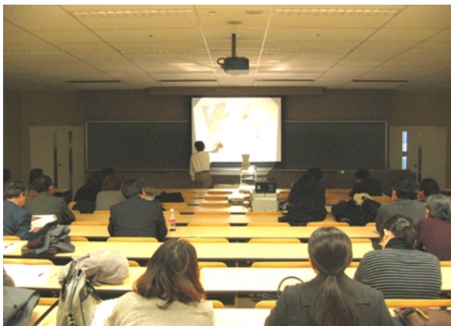
第四紀学会ミニ・シンポジウム「花粉分析から何がわかるか」の会場風景 .2003年2月1日に明治大学駿河台校舎を会場に開催された .本文5頁参照 .