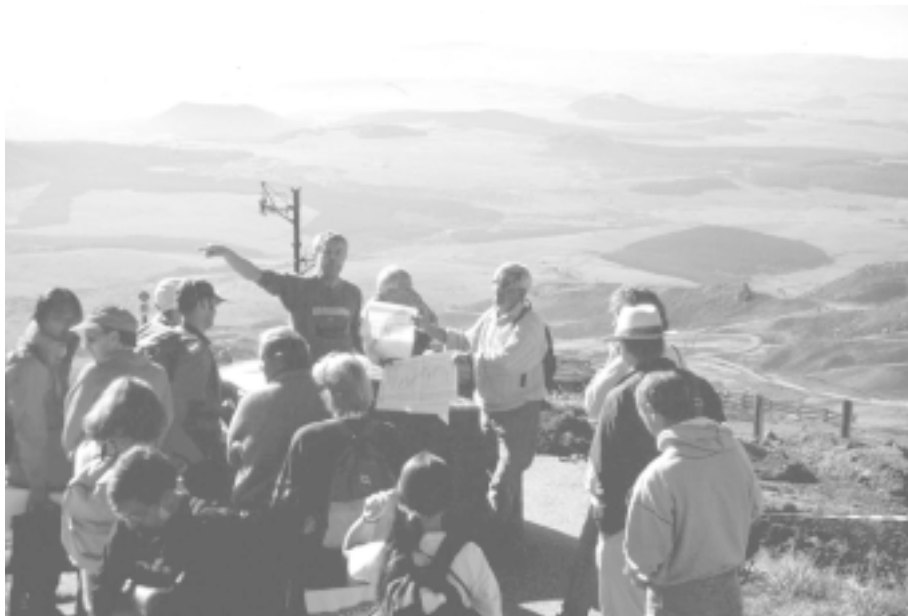
モン・ドール火山山頂近くでのジュヴィニエ博士による説明。背景はセザリエ火山群 (INQUA COT-UISPP 31 シンポジウム ポスト巡検：本文参照。撮影 - 早田 勉)