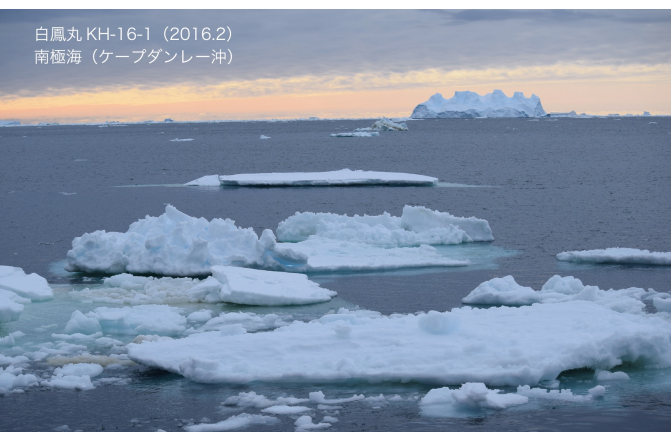
白鳳丸 KH-16-1 (2016.2) 南極海 (ケープダンレー沖)