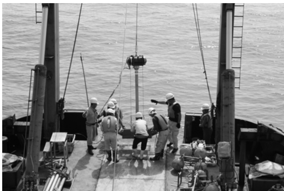
仙台湾における海底堆積物の採取風景。2011年の津波の痕跡が、仙台湾の底にどのように残されているかを調べた。