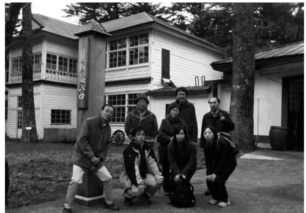
参加者集合写真 美郷町郷土資料館にて

2 日目は横手盆地東縁断層帯が形成する地形を中心に観察した。中山丘陵西縁地点では新第三系が傾斜している露頭の前で、テクトニックバルジに関する解説があった。中山丘