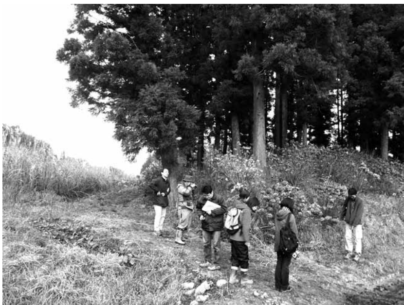
2009年度古地震・ネオテクトニクス研究委員会野外集会において訪れた●木立地点（岩手県一関市）。この地点では2008年岩手・宮城内陸地震に伴って南東側隆起の地表地震断層が現れた。発震機構や地殻変動から推定される地下の断層運動は北西側隆起の逆断層の活動であることから、この地点に現れた地表地震断層は副次的なものと思われる。写真右側の人物が指している付近に地表地震断層が現れた。参加者背後の杉の木の傾きは、断層運動により南東側（写真右側）が隆起したために生じた。 ●（ほの）＝木偏に爪