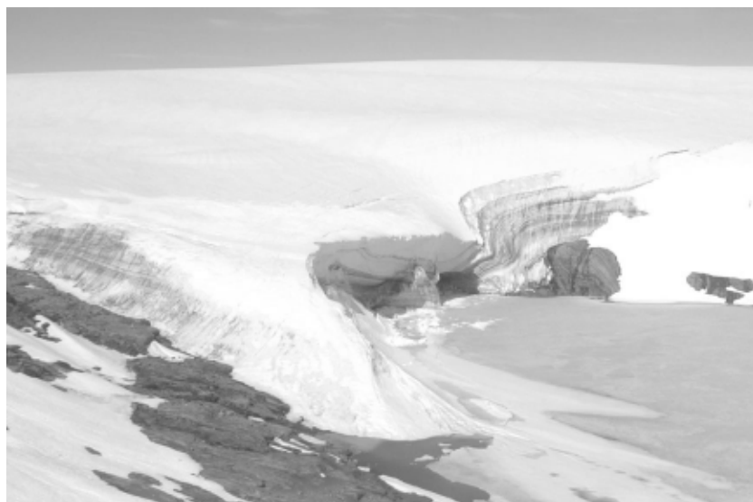
東南極、リュツォ・ホルム湾沿岸露岩域ルンドボークスヘッタのよごれ層を伴う氷崖と氷床縁、および氷床前縁湖(写真中央から右側下)。第47次日本南極地域観測隊地学・生物グループの夏期調査地。(2005年12月24日、47次越冬隊員・岩崎正吾撮影)