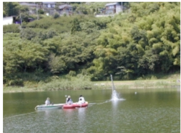
長野県深見池における野外講習会でのピストンコアリング。一つの失策は救命胴衣を付け忘れていること。