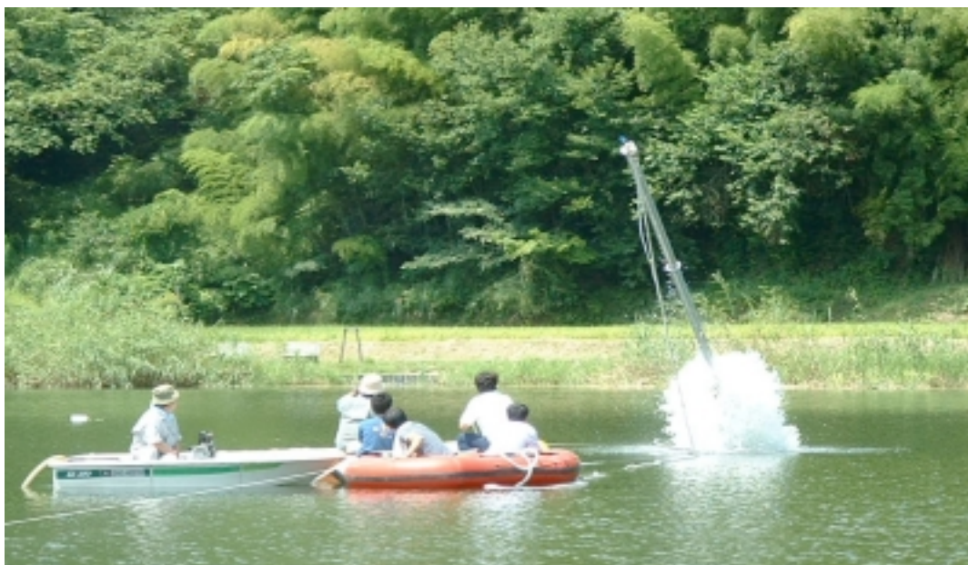
長野県深見池における野外講習会でのピストンコアリング。マッカラス空気圧入式サンプラーが水中から飛び出したところ。