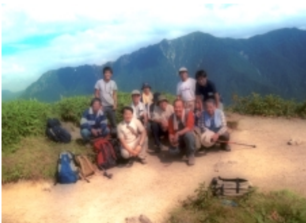
巡検参加者一同（浜田撮影）

【梓川右岸(明神橋上流すぐ)】: この付近の梓川は谷底平野を形成し網状河川の特徴を示す。その広い河原の中に見られるケショウヤナギなどの河辺林の説明があった。河辺林は洪水や砂礫の供給があるため生きながらえているそうである。このような自然状態で調節されたシステムがある中で、観光の中心である河童橋周辺の河床が高くなることを防止するために、周辺では砂礫の浚渫や帯工という堤体をつくる工事が行われている。しかし、これによってケ