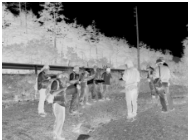
写真1 麦草峠東地点にて

地点1(麦草峠東)では黒曜岩がみられる(写真1)。この黒曜岩は従来後期更新世とされていたが、最近のK-Ar年代測定により0.26Ma、中期更新世の活動を示すとされ、層序の見直しがされている。また、ここは麦草峠周辺の遺跡で産出する石器の石材の原産地の一つとされて