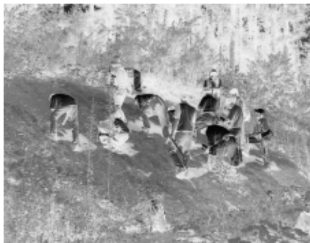
写真2 八ヶ岳起源テフラの観察