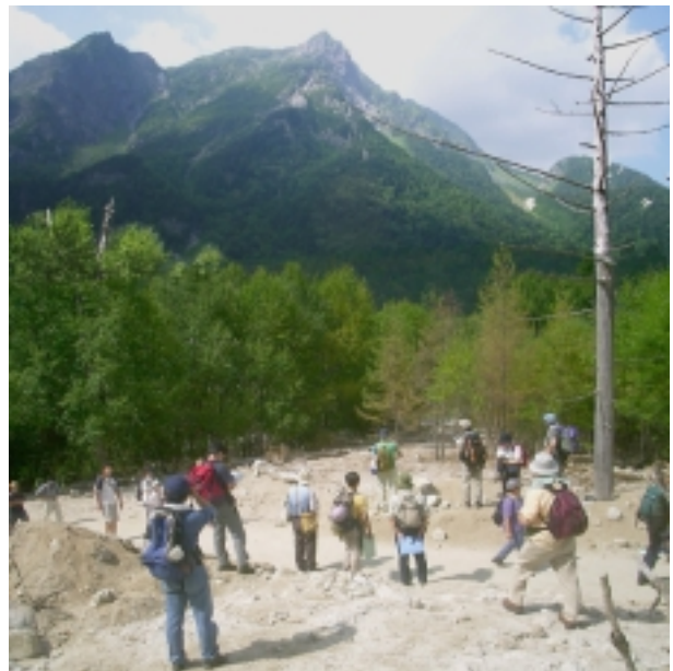
「梓川左岸下白沢(河童橋から上流2.5km) .7月に発生した土石流の堆積物(厚さ約30cm)を排除して写真左下から右下に登山道がはしる。奥の山稜は前穂高岳の前衛の明神岳」